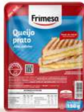
Queso Prato Feteado 200g Cód. 102955