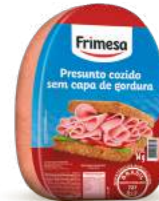
Jamon Cocido 3,4kg Cód. 000108