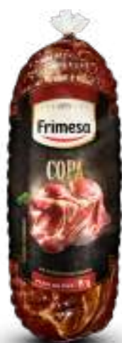
Sobrapaleta de Cerdo Condimentada y Ahumada - Copa 560g Cód. 076095