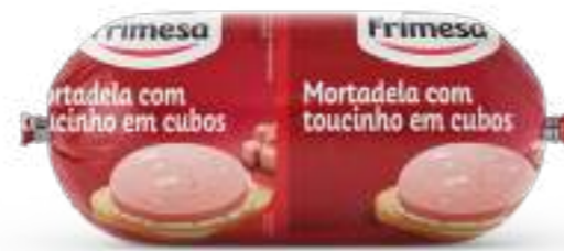
Mortadela con Tocino en Cubos 1,9kg Cód. 053625