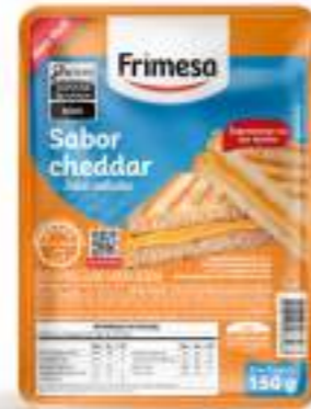
Queso Procesado Sabor Cheddar Feteado 200g Cód. 102956