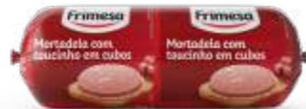
Mortadela con Tocino en Cubos 500g Cód. 093785