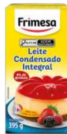
Leite Condensado 395g Cód. 023645