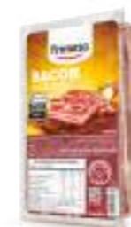
Panceta Ahumada - Bacon 300g Cód. 054285