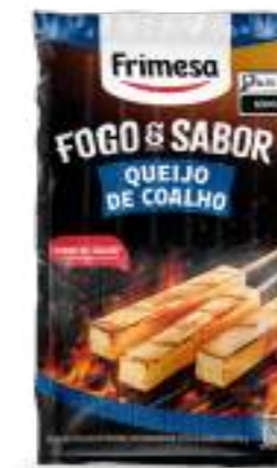
Queso de Quajo - Coalho 380g Cód. 096647