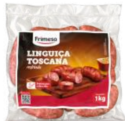
Chorizo de Cerdo – Toscana 1kg Cód. 052260