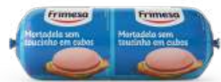
Mortadela sin Tocino en Cubos 500g Cód. 070944