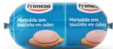
Mortadela sin Tocino en Cubos 1kg Cód. 093787