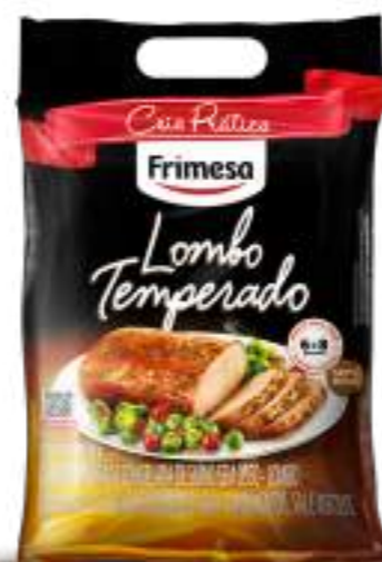
Carne de Cerdo sin Hueso Condimentada Congelada - Lombo 1,7kg Cód. 077423