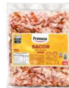
Panceta Ahumada - Bacon 1kg Cód. 070780