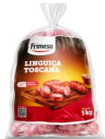
Chorizo de Cerdo – Toscana 5kg Cód. 070938