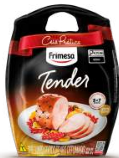
Jamon Cocido Ahumado - Tender 800g Cód. 077421