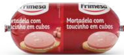
Mortadela con Tocino en Cubos 1kg Cód. 093783