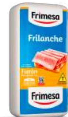
Fiambre - Frilanche 2,6kg Cód. 000057