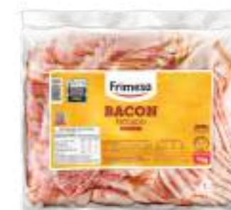
Panceta Ahumada - Bacon Feteado 1kg Cód. 070776