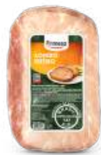
Carne Congelada de Cerdo sin Hueso - Lombo 1kg Cód. 086523