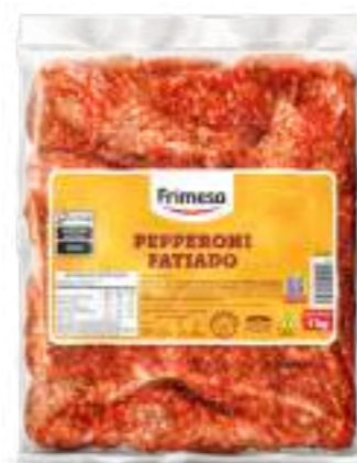
Pepperoni Feteado - Congelado 1kg Cód. 070781