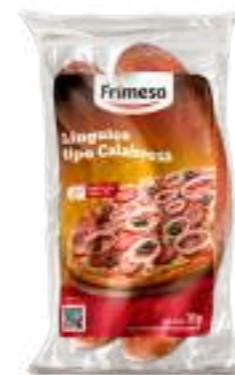
Salchicha Tipo Calabresa Cocida y Ahumada 400g Cód. 065436