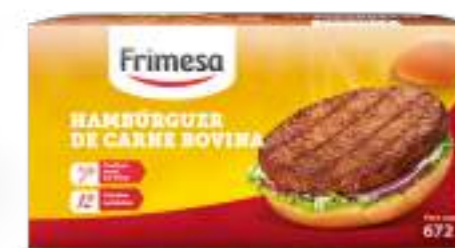
Hamburguesa de Carne Bovina 672g Cód. 084145