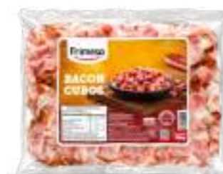
Panceta Ahumada - Bacon 400g Cód. 070952