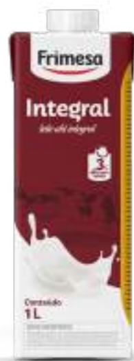
Leche Entera UHT 1L Cód. 055334