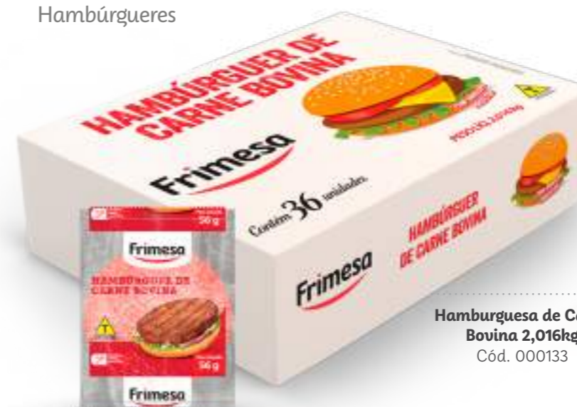
Hamburguesa de Carne Bovina 2,016kg Cód. 000133