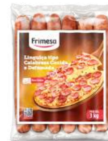
Salchicha Tipo Calabresa Cocida y Ahumada 3kg (Reta) Cód. 068044