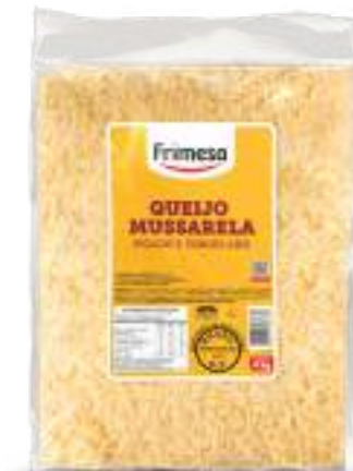
Queso Muzzarella Picado 4kg Cód. 084250