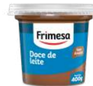
Dulce de Leche 400g Cód. 000448