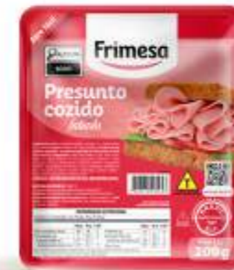
Jamon Cocido Feteado 200g Cód. 70686