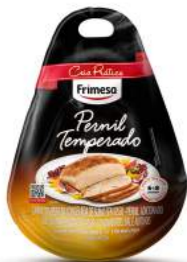
Carne de Cerdo sin Hueso Condimentada Congelada - Pernil 3kg Cód. 077422