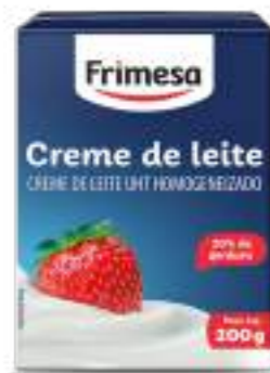
Crema de Leche UHT Homogeneizada 200g Cód. 023644