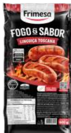
Chorizo de Cerdo – Toscana 600g Cód. 076197