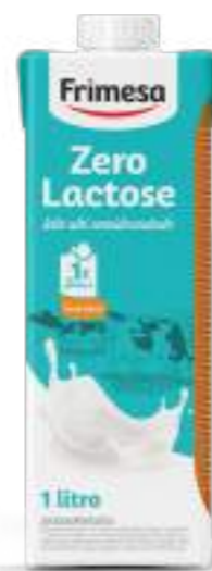
Leche Semidescremada UHT sin Lactosa – Zero Lactose 1L Cód. 056395