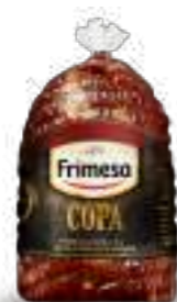
Sobrapaleta de Cerdo Condimentada y Ahumada - Copa 290g Cód. 076096