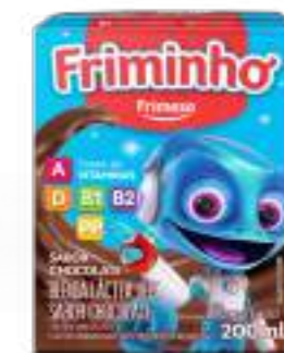
Bebida Láctea UHT Friminho 200ml Cod. 052991 (pack)