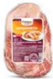
Carne Congelada de Cerdo sin Hueso - Matambrito 1kg Cód. 094263