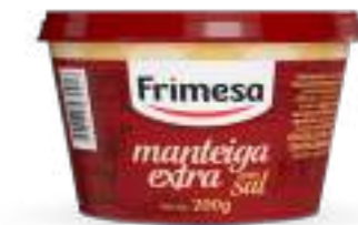
Manteca Extra con Sal 200g Cód. 084601