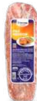
Carne Congelada de Cerdo sin Hueso - Filete 1kg Cód. 094265