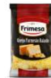
Queso Parmesano Rallado 50g Cód. 084249