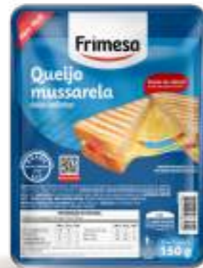
Queso Muzzarella Feteado 200g Cód. 102954