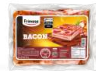
Panceta Ahumada - Bacon 2,5kg Cód. 070179