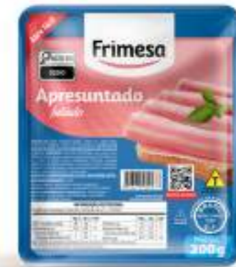
Jamonada Feteada 200g Cód. 70687