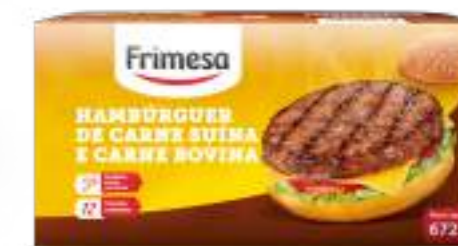
Hamburguesa de Carne de Cerdo y Carne Bovina - Hambúrguer 672g Cód. 084144