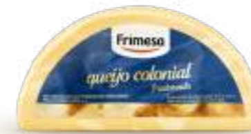
Queso - Colonial 500g Cód. 096648