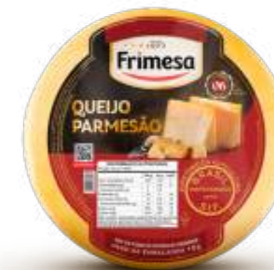
Queso Parmesano 5kg Cód. 084248