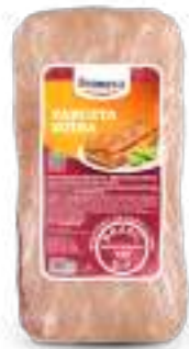
Carne Congelada de Cerdo sin Hueso - Panceta 1kg Cód. 086521