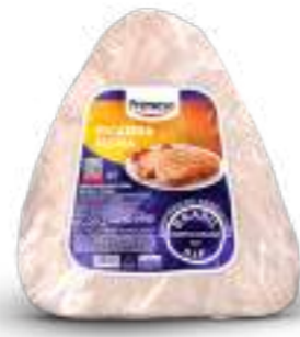
Carne Congelada de Cerdo sin Hueso - Picanha 1kg Cód. 086525