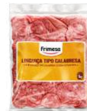
Salchicha Tipo Calabresa Feteada 1kg Cód. 056486