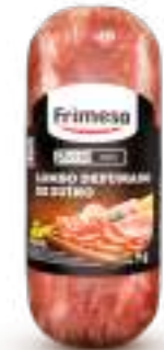
Lomo de Cerdo 340g Cód. 076099