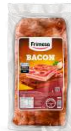
Panceta Ahumada - Bacon 3,2kg Cód. 000120