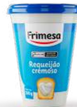
Requeson Cremoso 200g Cód. 079758