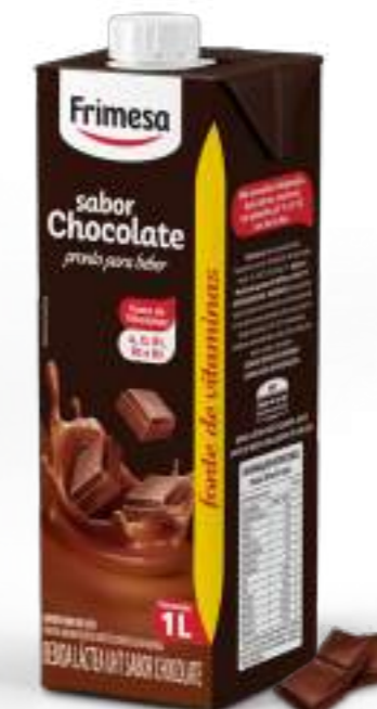
Bebida Lactea UHT sabor Chocolate 1L Cód. 055336