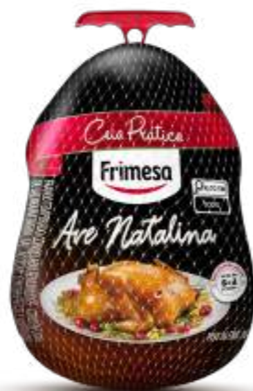
Pollo Condimentado Congelado 3,5kg a 4,5kg Cód. 061397