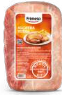
Carne Congelada de Cerdo sin Hueso - Alcatra 1kg Cód. 086519