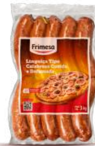
Salchicha Tipo Calabresa Cocida y Ahumada 3kg Cód. 023552