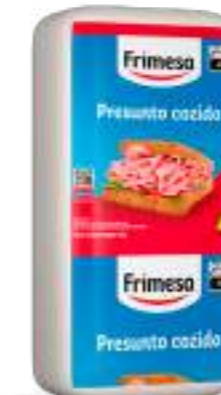
Jamon Cocido 3,9kg Cód. 058836