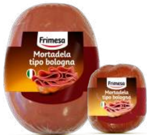
Mortadela Tipo Bologna 4,2kg Cód. 066462