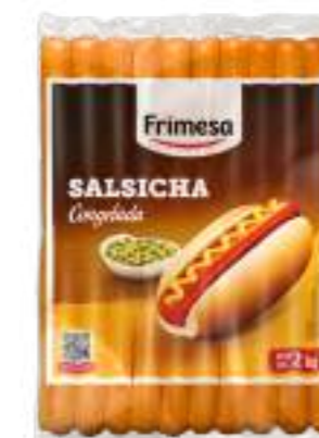
Salchicha Congelada 2kg Cód. 052264