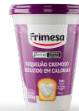
Requeson Cremoso Light 200g Cód. 079759