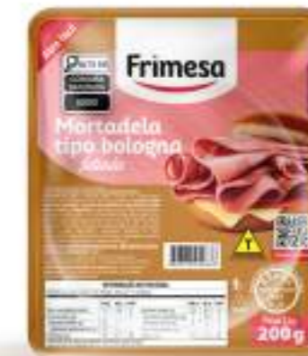
Mortadela Tipo Bologna Feteada 200g Cód. 70689