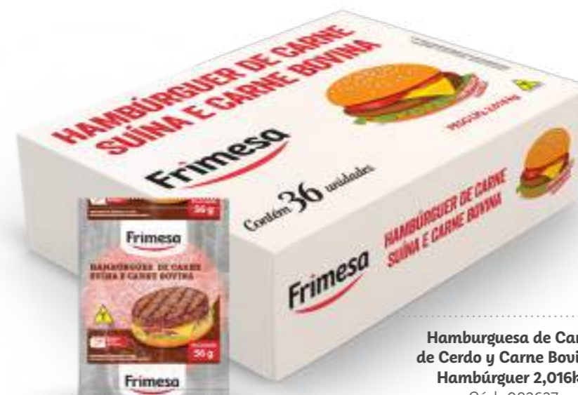
Hamburguesa de Carne de Cerdo y Carne Bovina - Hambúrguer 2,016kg Cód. 083637