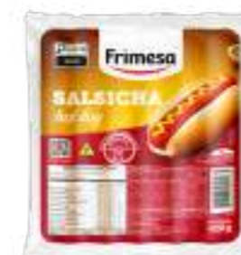
Salchicha - Hot Dog 420g Cód. 062973