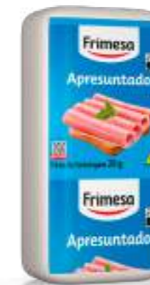
Jamonada 3,9kg Cód. 000052