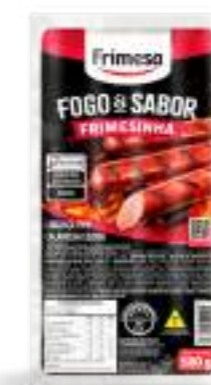
Salchicha Tipo Calabresa Cocida - Frimesinha 500g Cód. 076199