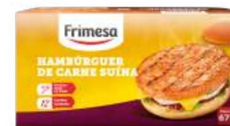
Hamburguesa de Carne de Cerdo 672g Cód. 074198