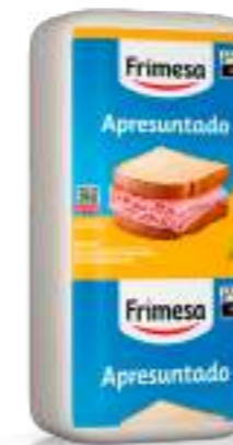
Jamonada 3,6kg Cód. 000110